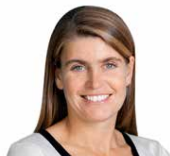
АННЕТТ МАГНУССОН, генеральный секретарь Арбитражного института Торговой палаты Стокгольма, Стокгольм