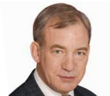
Джон Биичи, президент Международного третейского суда Международной торговой палаты, Париж